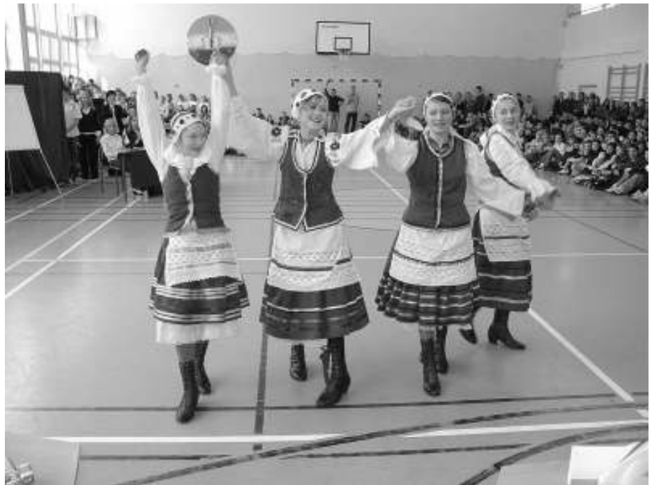
Poola rahvatantsijad

Kuna poolakad on väga külalishalke ja rõõmsameelne rahvas, tutvustati meile ka poola rahvatanstu, laule ja anti süüa poola rahvustoite. Muide, kas te teate, et poolakad söövad meie verivorstiga sarnast vorsti, mille täidiseks on tatrapuder. Kui meid viidi sööma maakonna parimasse