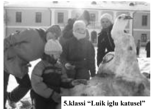
5.klassi "Luik iglu katusel"