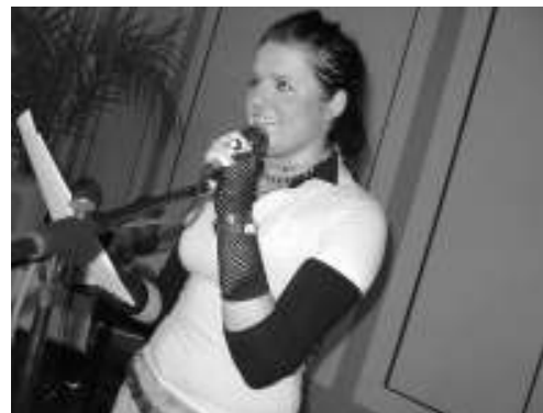
Mellu (küsija) suu pihta ei lööda!