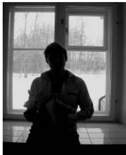
Anonüümne aknalaudur eksperim- menteerimas aknalaua võlusid ja valusid!

mööda vetsukabinettidesse, otsi- des seal alternatiivset tegevust tavapärasele kehakergendamisele. Jään huviga ootama, kes võidab vetsukuningamängu teise kvartali üldkarika, sest etapivõit on mul juba taskus!