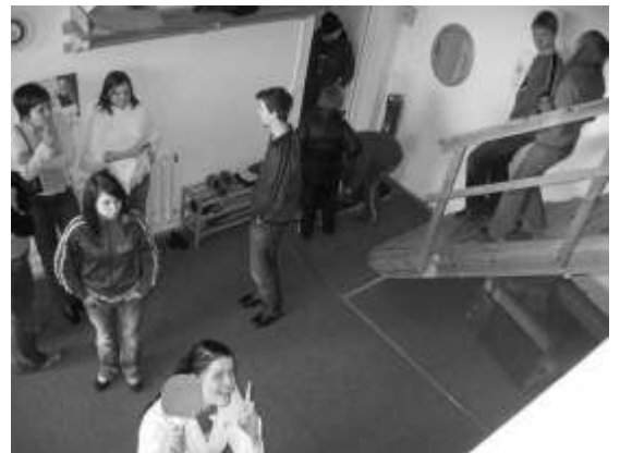
Õpilasesinduse parimad hetked Vändras.